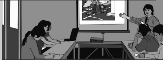
図125b 若年労働者が作業場の問題を話し合い、自分たちのニーズを反映した実際的な改善策を提案する機会を提供します。

若年労働者が十分な作業接します。問題が深刻にな労働者が若年労働者にオン支援します。