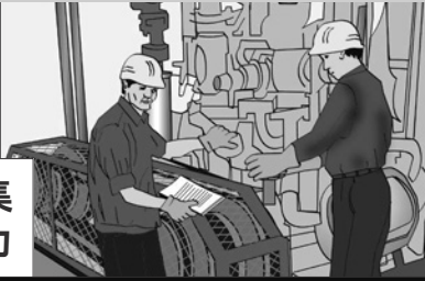
図125a 若年労働者に対して、彼らの背景経験、知識、スキル、体力を考慮しながら、作業中にリスクに対処する方法を訓練します。